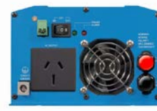
Phoenix Wechselrichter 12/800 mit AN/NZS 3112 Steckdose