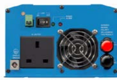
Phoenix Wechselrichter 12/800 mit BS 1363 Steckdose