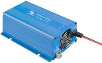
Phoenix Wechselrichter 12/180