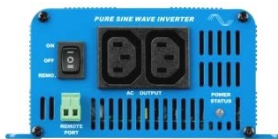
Phoenix Wechselrichter 12/350 mit IEC-320 Steckdosen