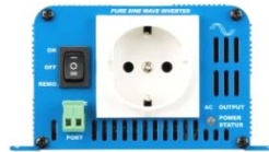
Phoenix Wechselrichter 12/180 mit Schuko Steckdose