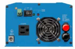
Phoenix Wechselrichter 12/800 mit Nema 5-15R Steckdose