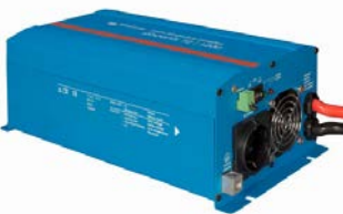
Phoenix Wechselrichter 12/800 mit Schuko Steckdose