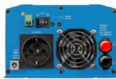
Phoenix Wechselrichter 12/800 mit Schuko Steckdose