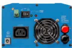
Phoenix Wechselrichter 12/800 mit IEC-320 Steckdose