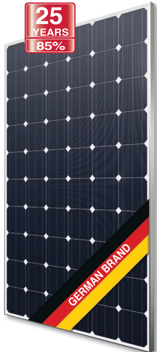
Abb. ähnlich 60M156DE171019A